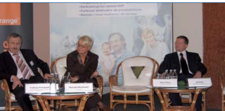
Konferencja z cyklu Głos Biznesu. Rzeszów, 29 listopada 2005 r.

Każdej sesji towarzyszyło centrum informacyjne dla przedsiębiorców z zakresu finansowania działalności.