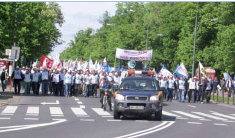
Dialog społeczny czy petardy?

Manifestacja OPZZ, która odbyła się m.in. pod siedzibą PKPP Lewiatan, 19 maja 2005 r.