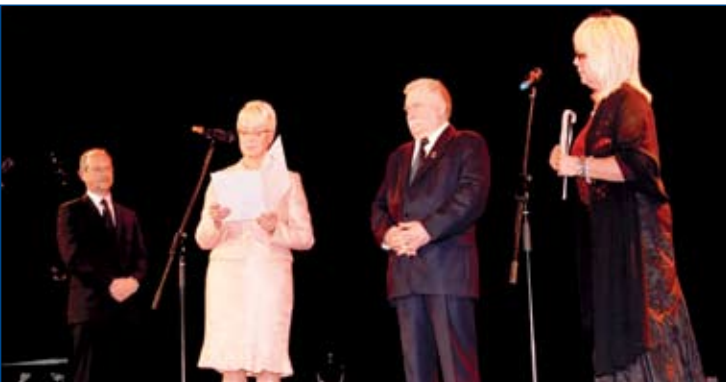
Lech Wałęsa odbiera Nagrodę Specjalną Lewiatana.