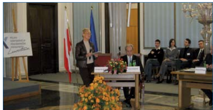
PKPP Lewiatan przedstawia w Sejmie RP wnioski z kolejnej edycji raportu „Konkurencyjność sektora MSP”. Warszawa, 21 marca 2005 r.

Coroczna prezentacja w Sejmie wyników badania PKPP Lewiatan na reprezentatywnej grupie MSP (1000 firm, 80 pytań) - ocena zmian w sektorze MSP, określenie nowych barier rozwoju a przede wszystkim dyskusja nad możliwościami i sposobami rozwiązań, które najlepiej służą podnoszeniu konkurencyjności polskich przedsiębiorstw, w przeddzień akcesji Polski do UE. Wśród uczestników przedstawiciele: władzy ustawodawczej i wykonawczej, administracji i samorządu terytorialnego, organizacji i stowarzyszeń biznesowych, przedsiębiorców i prezesów firm, ekspertów i dziennikarzy.