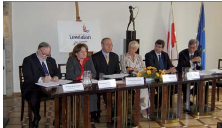
Konferencja prasowa inaugurująca Sąd Arbitrażowy przy PKPP Lewiatan.

Zmiana prawa arbitrażowego (weszło w życie 17 października 2005 r. i – w dziedzinie mediacji – 10 grudnia 2005 r.), wpłynęła na zwiększenie intensywności kontaktów z dziennikarzami, w szczególności zajmujących się tematyką prawną i ekonomiczną. W 2005 roku odbyły się trzy konferencje prasowe poświęcone problemowi arbitrażu w Polsce.