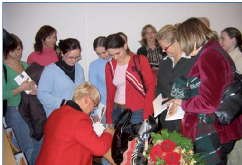
Henryka Bochniarz Prezydent PKPP Lewiatan zachęca studentów Politechniki Gdańskiej do zakładania własnych firm.