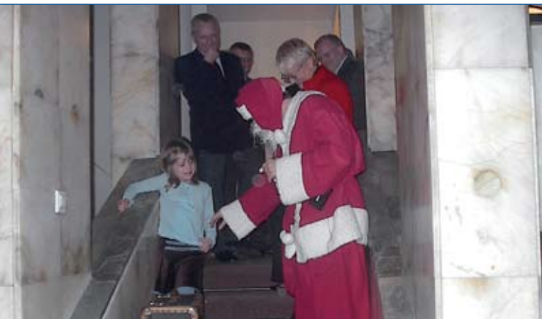
Święty Mikołaj w Lewiatanie.

W roku 2005 Polska Konfederacja Pracodawców Prywatnych Lewiatan była obowiązana uzyskać postanowienie Sądu Okręgowego w Warszawie stwierdzające jej reprezentatywność zgodnie z art. 2 ustawy z dnia 18 grudnia 2002 r. o zmianie ustawy o Trójstronnej Komisji do Spraw Społeczno-Gospodarczych i Wojewódzkich Komisjach Dialogu Społecznego. W wyniku przeprowadzonego badania reprezentatywności, stosowne oświadczenia złożyły 42 związki regionalne i branżowe oraz wszystkie firmy członkowie bezpośredni (15), łącznie 57 z 68 członków PKPP Lewiatan. Złożone oświadczenia potwierdziły, iż pracodawcy zrzeszeni w PKPP Lewiatan zatrudniają 564 114 pracowników, a podstawowy rodzaj działalności firm członkowskich określa 15 z 17 sekcji PKD. Na podstawie wniosku PKPP Lewiatan o stwierdzenie reprezentatywności Sąd Okręgowy w Warszawie VII wydział Cywilny Rejestrowy wydał postanowienie stwierdzające reprezentatywność Polskiej Konfederacji Pracodawców Prywatnych Lewiatan.