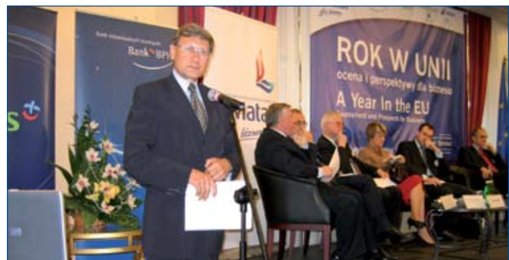
Leszek Balcerowicz wśród panelistów konferencji „Rok w Unii”. Kraków, 19 maja 2005 r.

Konferencja międzynarodowa „Rok w Unii: ocena i perspektywy dla biznesu”, której tematem były: wszechstronna ocena pierwszych doświadczeń wynikających z obecnego rozszerzenia Unii Europejskiej, refleksja nad dalszą perspektywą integracji oraz wyprowadzenie stąd wniosków dla środowisk biznesu. Uczestniczyli w niej przedsiębiorcy, politycy, przedstawiciele administracji i mediów. Reprezentowane były organizacje pracodawców z kilku państw członkowskich UE. Swego patronatu udzielił Przewodniczący Komisji Europejskiej J. M. Barroso. Przyznano odznaczenia państwowe zasłużonym dla PKPP Lewiatan.