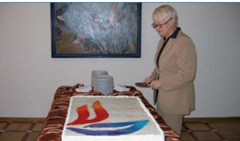
Świętujemy wprowadzenie nowego logo Lewiatana.

Jednym z najważniejszych zadań zespołu PR w 2005 r. było wprowadzenie nowego systemu identyfikacji wizualnej, związane z poszerzeniem nazwy Konfederacji o członka Lewiatana, w tym opracowanie nowego znaku graficznego. Autorem nowego systemu identyfikacyjnego jest firma Brand Nature Access. Nowe logo jest proste i charakterystyczne. Samo w sobie jest dwubarwnym monogramem stylizowanej litery L, ukształtowanym tak, że wywołuje wielorakie pozytywne skojarzenia symboliczne. W literze L można bowiem dopatrzeć się różnorodnych motywów, metaforyzujących wartości, styl pracy, sposób działania Polskiej Konfederacji Pracodawców Prywatnych Lewiatan. Znak przywołuje na myśl dłoń niosącą płomień, rozpostarte w locie skrzydła, syntezę ognia i wody. Nowy znak wywołuje w nas dużo pozytywnych emocji i doceniamy pracę